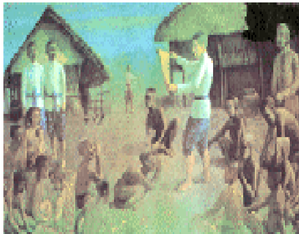
โปรดเกล้าฯ ให้ประกาศเลิกทาสในเมืองไทย

เลิกทาส / ด้านการปกครอง / การสาธารณสุข / โภค / การศึกษา / การปกป้องประเทศ / การเสด็จ ประพาส